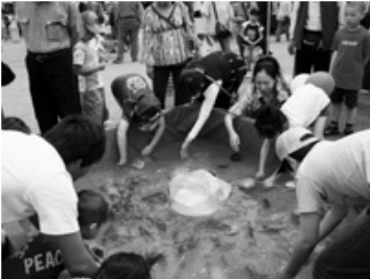
とても賑わいました!

当日は特産物販売コーナーや観光PRコーナー、あまごの掴み取りコーナー等を設けて東大阪市民の方々に下北山村をPRしました。昨年は猛暑に見舞われましたが、今年も天候にも恵まれ、どのコーナーにも多くの皆様に訪れて頂きました。